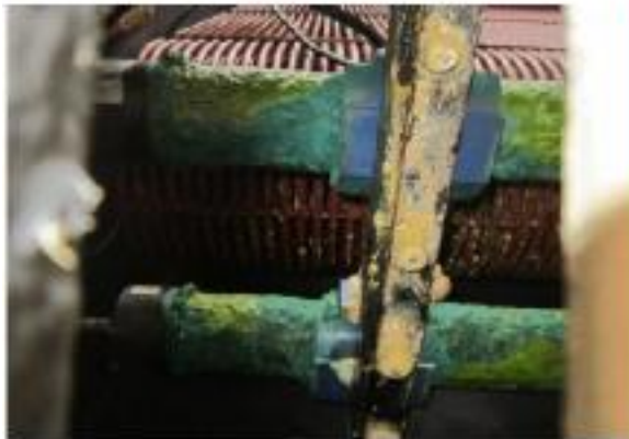
ANODE & CATHODE